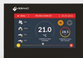
Regulator w wersji czarnej (VER-44 WiFi Czarny)